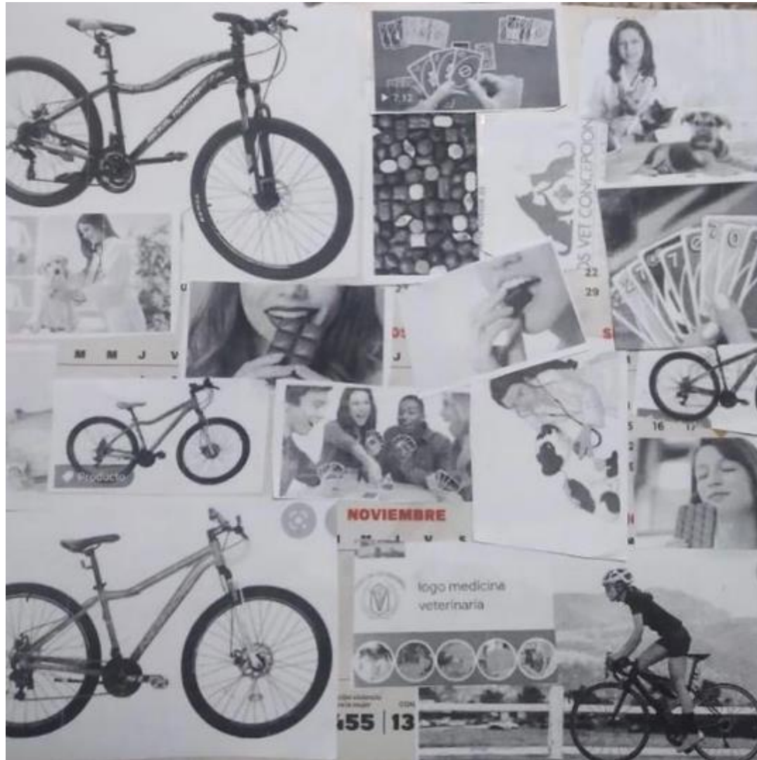
Javiera Hidalgo, Grupo Rucapillan