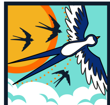
GUÍA DE VUELO