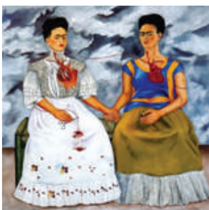
LAS DOS FRIDAS FRIDA KAHLO