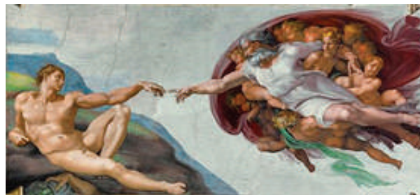
LA CREACIÓN DE ADÁN MIGUEL ÁNGEL