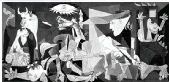
GUERNICA - PICASSO