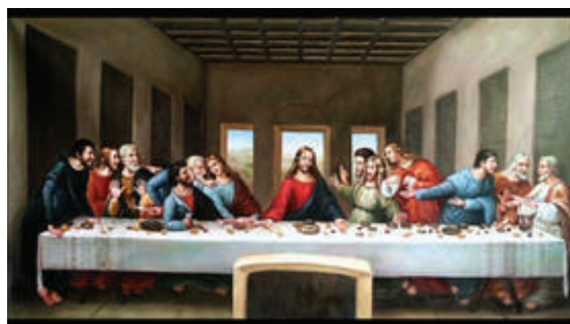
LA ÚLTIMA CENA LEONARDO DA VINCI