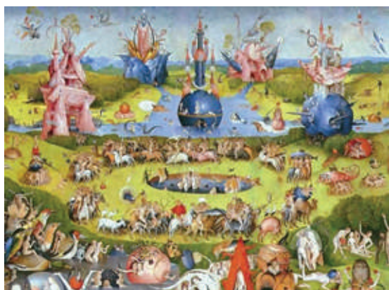
EL JARDÍN DE LAS DELICIAS EL BOSCO