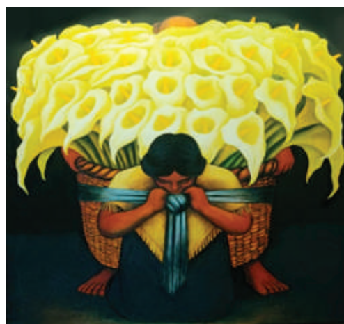
EL VENDEDOR DE ALCATRACES DIEGO RIVERA