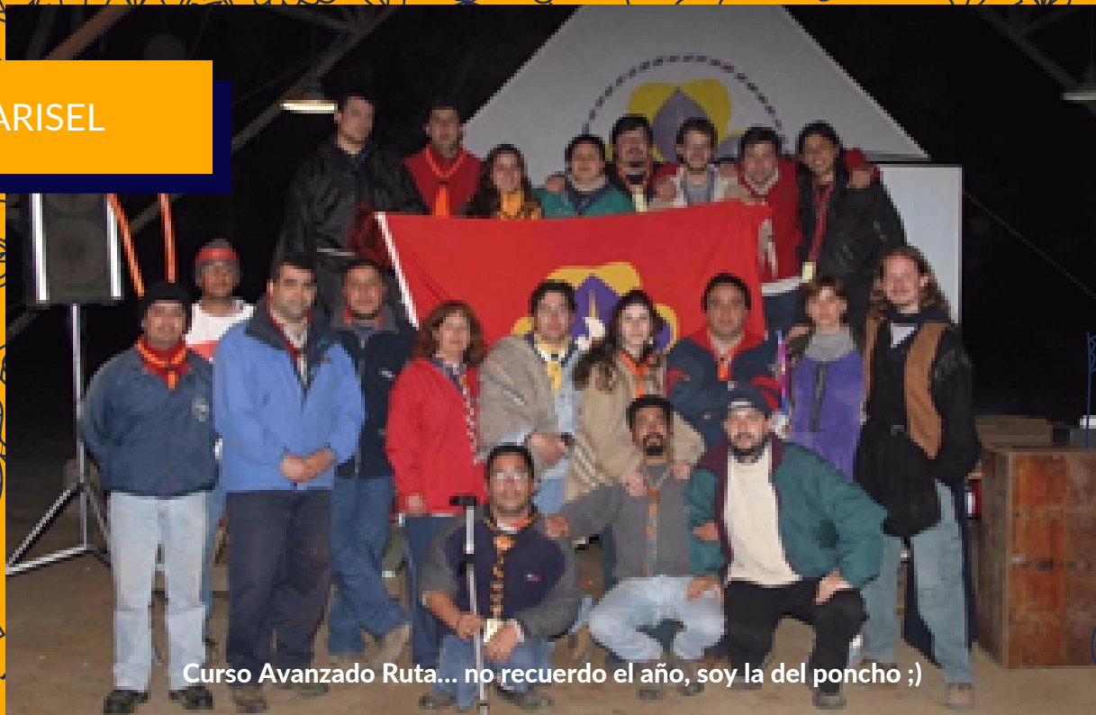
Curso Avanzado Ruta... no recuerdo el año, soy la del poncho ;)

Hoy soy embajadora, feliz y agradecida de poder seguir participando, contribuyendo con un granito de arena para que la AGSCh siga existiendo.