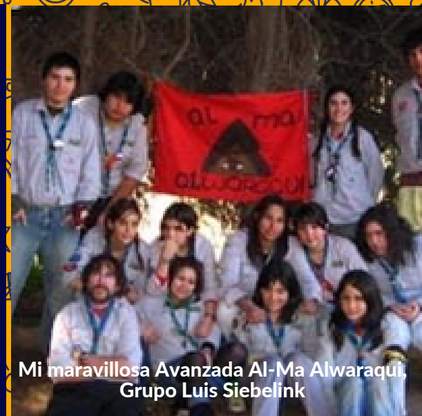
Mi maravillosa Avanzada Al-Ma Alwaraquí, Grupo Luis Siebelink

El Movimiento me cambió, me hizo mirar y enfrentar la vida de una manera más solidaria, empática, con valores y principios importantes, que hoy trato de transmitir a mi hijo y quisiera que muchos niños pudieran vivirlo personalmente.