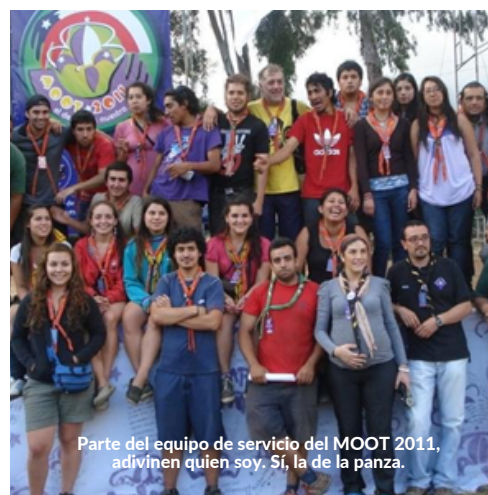
Parte del equipo de servicio del MOOT 2011, adivinen quien soy. Sí, la de la panza.