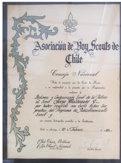
Mi diploma que aún conservo en mi casa, como testimonio de esta condecoración.

En esta ceremonia se nos entregó la medalla muy bonita y un diploma que hasta el día de hoy forman parte de mis tesoros scouts. Me acuerdo que me hice muy famoso en Concepción ya que una foto mía estaba incluida en una Gran Exposición que hizo el Gobierno como testimonio de las actividades realizadas por la visita del Presidente a Concepción.