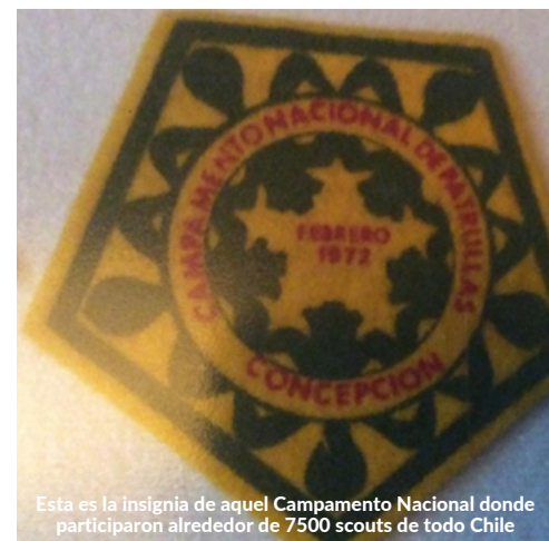
Esta es la insignia de aquel Campamento Nacional donde participaron alrededor de 7500 scouts de todo Chile