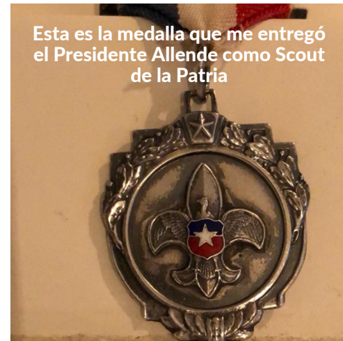
Esta es la medalla que me entregó el Presidente Allende como Scout de la Patria