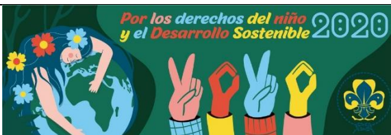
Clan Futalhue del Grupo Santa Clara