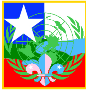
Máximo Pizarro Araya